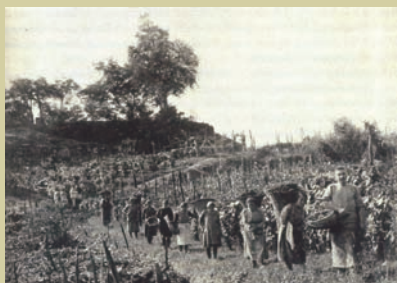
Ritorno dalla vendemmia in Toscana. Tratto da Zeffiro Ciuffoletti Storia del vino in Toscana. Dagli etruschi ai nostri giorni , edizioni Polistampa, Firenze 2000.

durre fiaschi di nuova concezione, con un ispessimento della parte finale del collo, affinché il vetro potesse sostenere la pressione del tappo. I primi esperimenti si ebbero in Toscana a partire dal 1865/68, all'interno di una vetreria di Pontassieve, con la consulenza di un giovane proprietario terriero proveniente dalla Francia. Questi si chiamava Vittorio degli Albizi ed era padrone delle fattorie di Pomino, Nipozzano e di un'altra grande fattoria vicino a Pontassieve. Vittorio apparteneva ad un ramo della famiglia degli Albizi, che aveva dovuto prendere la via dell'esilio a causa delle sue posizioni an-